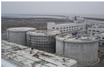
台州联化废水二期项目