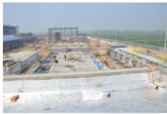
德州联化废水二期项目