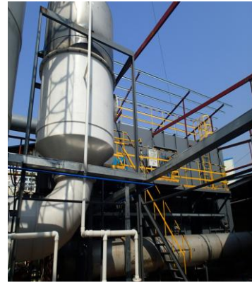
蓄热式高温氧化设备 RTO (节能型)

天的废水建设项目，提高废水治理能力。在废水处理设计过程中，委托 Bayer 工程设计公司对废水处理，尤其是废水的分类和预处理进行概念性设计，为联化废水的优化处理提供指导。