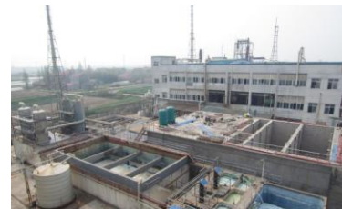
湖北郡泰废水二期项目